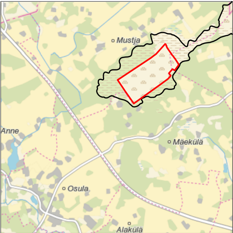
Kaardileht nr 5421 Antsla